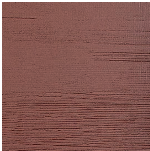
60 x 60 cm (23.6 x 23.6) OE.KV.MSA.2424