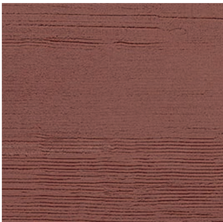
75 x 75 cm (29.53 x 29.53) OE.KV.MSA.3030

Tous les items présentés dans ce document font partie du programme d'inventaire Olympia. Pour les commandes spéciales, veuillez contacter votre représentant de Tuiles Olympia.