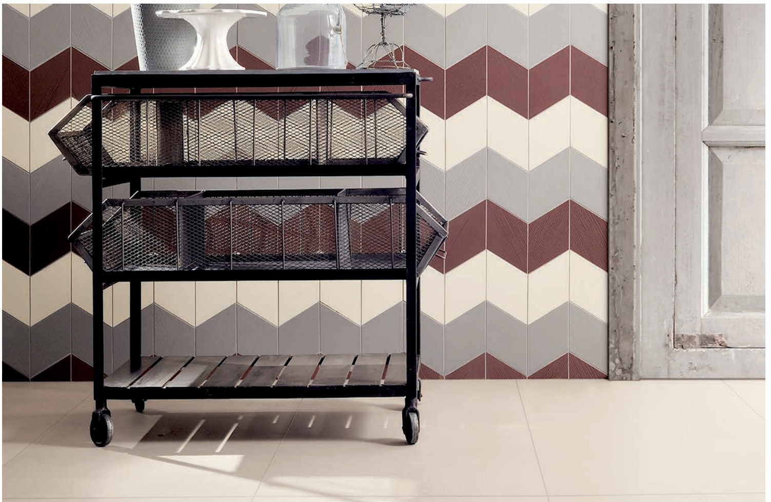
Mur (Rombo) : CENERE (Gris), MARSALA (Bougogne), LINO (Blanc) & CENERE (Gris)