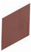
14 x 24 cm (5.5 x 9.5) OE.KV.MSA.0610.ROMBO