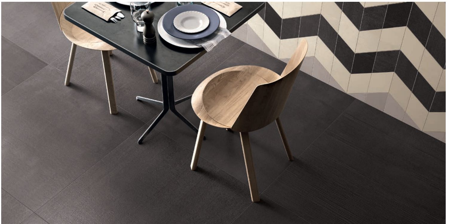
Mur (Rombo) : GRAFITE (Charbon), LINO (Blanc) & CENERE (Gris) Plancher: GRAFITE (Charbon)